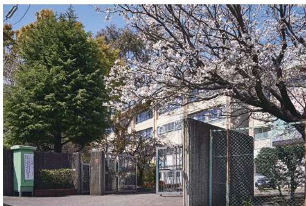
西有馬小学校 600m(徒歩約7分)