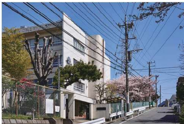
有馬中学校 650m(徒歩約9分)